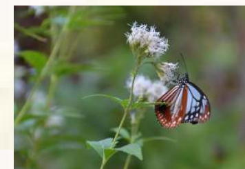
<白花フジバカマとアサギマダラ>